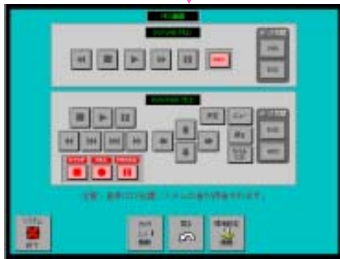
録音・録画設定画面

DVD/HDD、DV/VHSは手動で電源を切ってください。その他の機器は手を触れないでください。