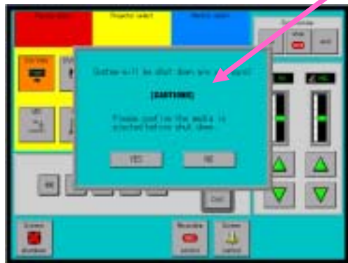
システム・シャットダウン確認画面